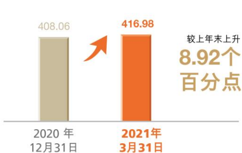
拨备覆盖率 (百分比)