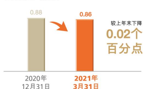
不良贷款率 (百分比)