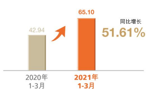
手续费及佣金净收入 (亿元)