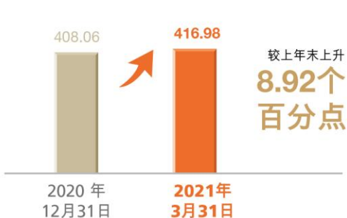
拨备覆盖率 (百分比)