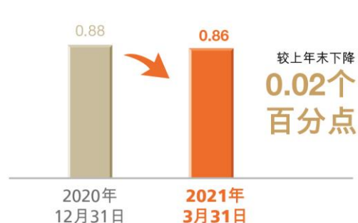
不良贷款率 (百分比)