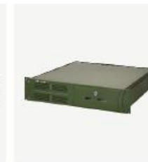
企业级核心网产品 TCN1000R