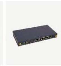
室内型 CPE BL7460