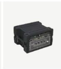
一体化快速部署系统 SRD2000