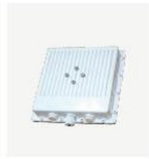
室外型 CPE BL8410