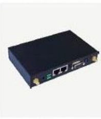
MEM 模块 MEM130