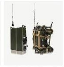
多媒体背负式终端 MBT 系列