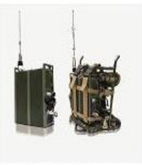
多媒体背负式终端 MBT 系列