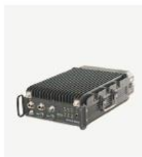
aMESH 设备 MESH1002