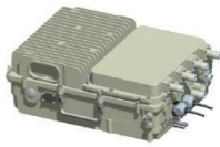
大功率一体化产品 XM6114