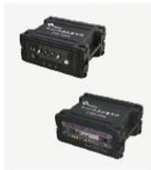
分体式快速部署系统 SRD1000