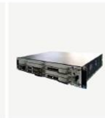
插卡式 BBU XWB7500