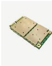
Mini PCI-E 接口嵌入式模块 MPE168