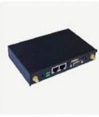
MEM 模块 MEM130