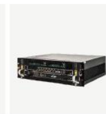
企业级核心网产品 TCN1000E