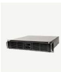
企业级核心网产品 TCN1000