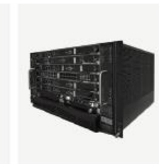
运营级核心网产品 TCN2000S