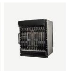
运营级核心网产品 TCN2000