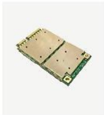
Mini PCI-E 接口嵌入式模块 MPE168