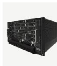
运营级核心网产品 TCN2000S