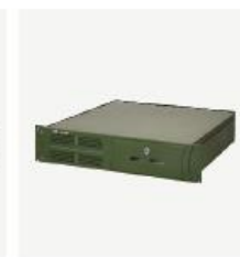
企业级核心网产品 TCN1000R