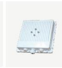
室外型 CPE BL8410