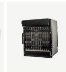
运营级核心网产品 TCN2000