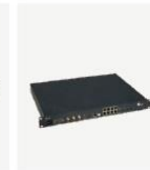
单板式 BBU XWB6400