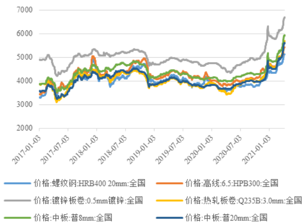
图2：近年来我国部分钢材品种价格走势（元/吨）

续下行趋势，于5月初降至96.62点，达到近年来低位；但随着国内疫情得到有效控制，建筑业及制造业有序复工复产为钢材需求带来强劲支撑，钢价呈现稳步上升趋势，并于12月末升至近年来高点。2021年以来，受补库存需求拉动，以及“碳中和”目标及3月唐山限产对市场预期造成影响，钢价经历1~2月小幅下滑后迅速上升，4月初钢材价格指数已升至140.67点。