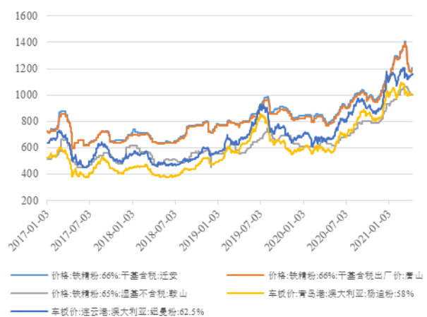
图3：近年来国内外铁精粉价格走势（元/吨、元/湿吨）

石。同期我国进口铁矿石11.7亿吨，同比增长9.5%，全年进口铁矿石平均价格为101.65美元/吨，同比增加7.2%，进口总量保持稳定的同时，进口价格小幅上涨，但考虑到全年钢价涨幅亦较为有限，钢铁企业盈利空间仍有所收窄。中诚信国际认为，2021年以来，普氏指数快速上升后回落，但仍处于高位，考虑到目前钢材价格亦处于历史相对高点，钢铁企业整体利润空间相对较大，并将对进口铁矿石价格的波动保持关注。