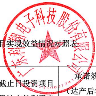
附件 2：前次募集资金投资项目实现效益情况对照表