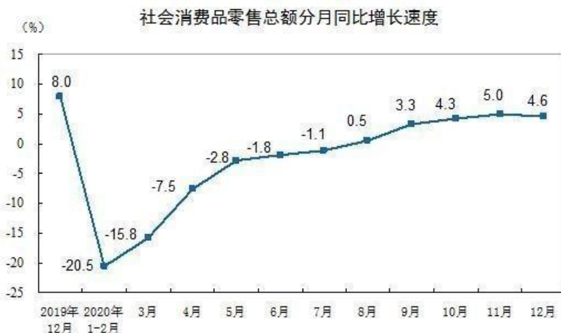
图表 1

2020年，疫情的持续蔓延造成大量负面影响，全球经济增长遭遇金融危机以来的最低水平，国内社会经济承压下行，零售行业更是受此次黑天鹅事件影响的“重灾区”，行业整体风险水平陡然上升。根据国家统计局最新发布的《2020年国民经济和社会发展统计公报》显示，2020年全年国内生产总值1,015,986亿元，比上年增长2.3%。其中，全年最终消费支出拉动国内生产总值下降0.5个百分点；社会消费品零售总额391,981亿元，比上年下降3.9%。2020年3月份后，随着各项强力措施出台，国内疫情得到明显遏制，消费品零售走出低谷，呈现明显反弹，经济亦同时加速回暖。