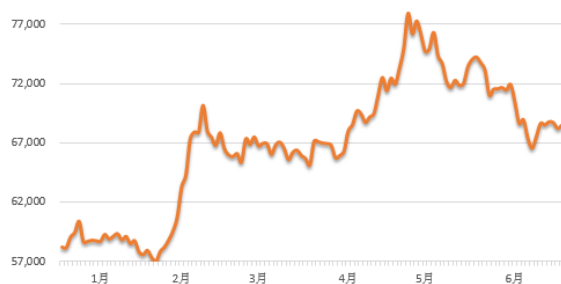
图：2021 年 1-6 月铜材价格走势（元）

综上所述，报告期内，公司综合毛利率为 16.67%，同比下降 2.27 个百分点，影响利润总额减少 2109.17 万元。