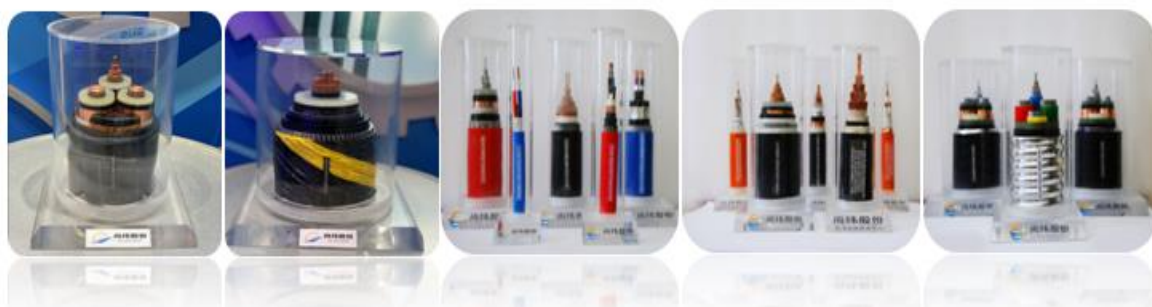
图：公司部分电缆产品

公司是集高端特种电缆产品的研发、生产、销售和服务于一体的国家高新技术企业。公司主要产品包括核电站用电缆、轨道交通用电缆、中压交联电缆、高压电力电缆、太阳能光伏发电用电缆、矿用电缆、船用电缆、风力发电用电缆、军工航天航空用电缆、海上石油平台用电缆等，并被广泛应用于核电、轨道交通、国网电力、光电、风电、化工、石油石化、军工、航天航空等诸多领域。