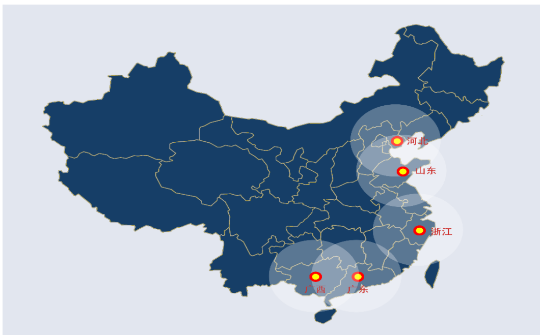
图 3 公司气源布局及辐射区域

公司控股子公司华恒能源在依托中国石化青岛董家口 LNG 接收站为主要气源的基础上，在广西、广东等区域围绕中国石化北海 LNG 接收站开展贸易和物流布局。公司辐射的市场区域覆盖了华北、华东、华南等主要的天然气消费区域，这些区域由于处于“西气东输”等主要管线的末端，客户最终获得管道气的价格有可能高于 LNG 的现货到站价格，因此也是主要的 LNG 市场区域。