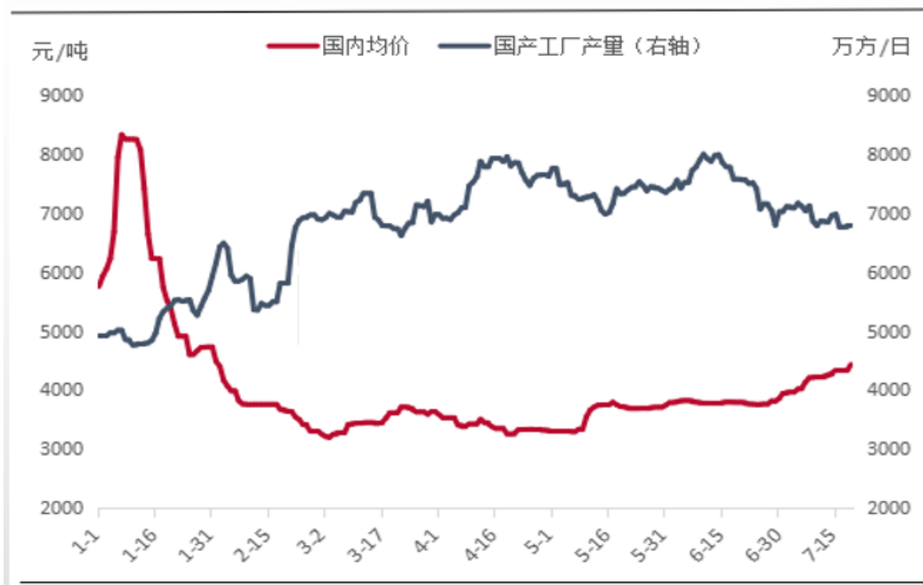
图 1 国内均价和国产 LNG 供应量走势对比（数据来源于：隆众资讯）