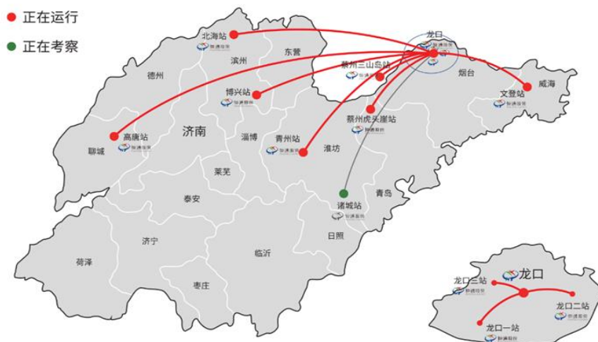
图4 恒福绿洲加气站分布