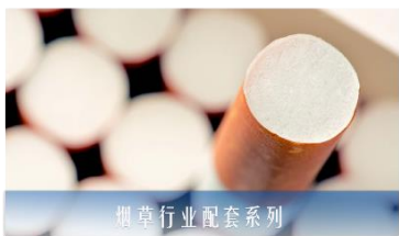
烟草行业配套系列