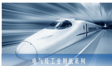
电气及工业用纸系列