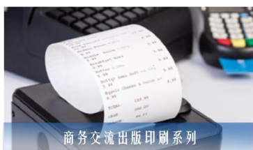
商务交流出版印刷系列