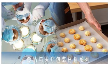
食品与医疗包装材料系列

公司属于造纸和纸制品业，细分为特种纸行业和高性能纸及纤维复合新材料。特种纸是一种高性能纸基功能材料，具有科技含量高、附加值高的特点，适用于多种领域的具有特殊机能的易耗材料，在浙江省新材料产业发展十四五规划中被列为“先进基础材料”和“关键战略材料”。