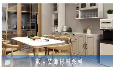
家居装饰材料系列

公司主营业务为研发、生产和销售高性能纸基功能材料及其浆类原材料和化学原材料，是国内大型高性能纸基功能材料研发和生产企业。