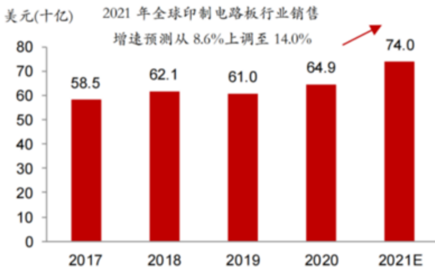
图表 PCB行业规模变化

需求端：受益于全球范围内的经济复苏以及疫情的有效缓解，被抑制的消费需求在2021年上半年快速反弹，PCB行业的景气度持续上升。据Prismark统计，2020年全球PCB产值估计达到652.19亿美元，同比增长6.4%，根据prismark机构的行业预测分析，2021年第一季度全球前40名厂商的总收入同比增长了29.9%，基于一季度的超预期数据，Prismark上调了PCB行业全年的增速预期，从之前的8.6%上升为14.0%。