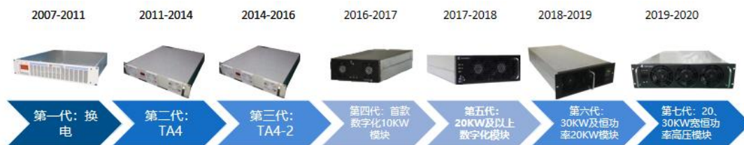
图2 公司充电模块产品七代更迭示意图