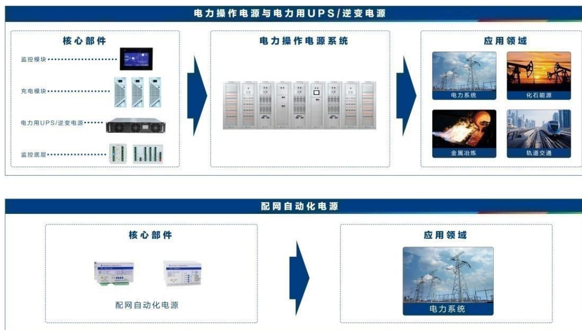
图1 智能电网产品及应用示意图

③电力配网自动化电源：公司具备电力配网自动化电源系列产品的研发、生产和销售能力。产品主要包括24V、48V两个电压等级和300W、500W至2000W的功率等级，单路、双路及多路系统拓扑，以及适应电池和超级电容不同负载形式的产品。主要应用于电力配网自动化终端FTU、DTU等内部直流供电。