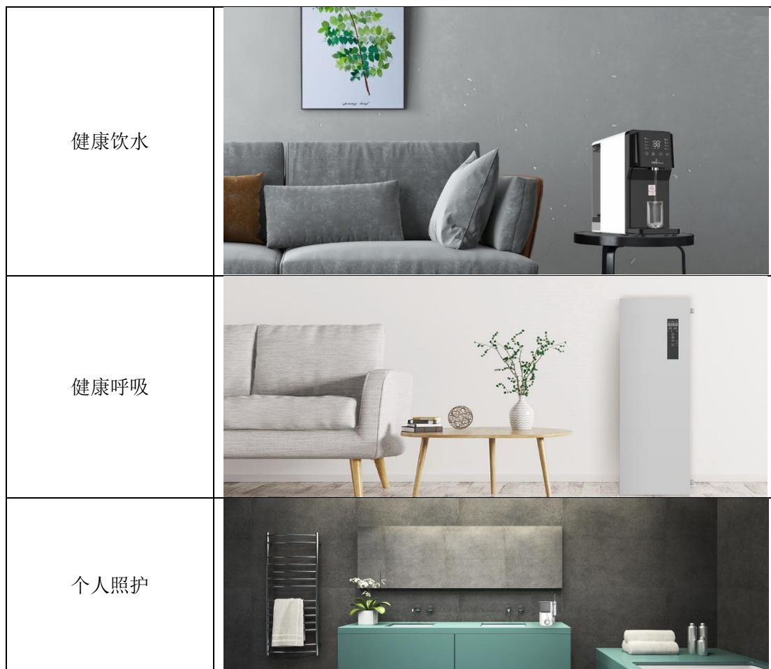
注：公司产品种类众多，以上仅为部分产品展示效果图。