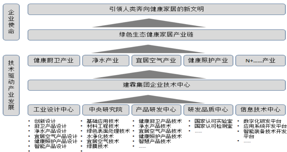
建霖家居技术驱动发展模型图

持续不断的技研创新是公司的核心竞争力，也是推动长足发展的源泉和动力。公司秉持技术驱动发展战略，凭借技术服务整合能力，驱动产品创新及制造发展，满足市场及客户多元化需求的经营模式，持续创新产品和技术，形成以健康、智能、品质为导向的产品体系，以高端化、数字化、绿色化为目标的产业发展，以优质产品与解决方案致力于持续改善大众的生活品质，推动健康家居产业的全面发展。