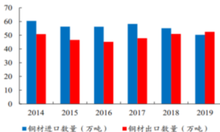
我国铜合金材进出口数量