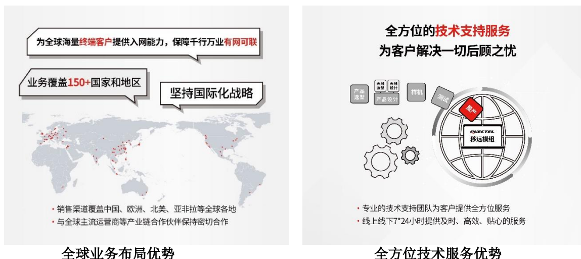
全球业务布局优势