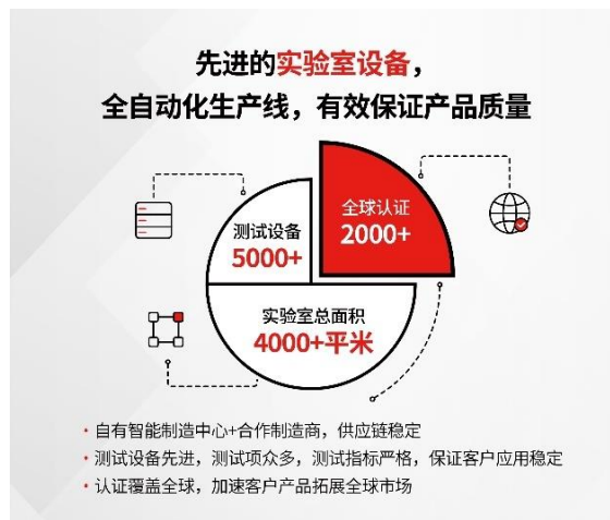
供应链及产品质量优势