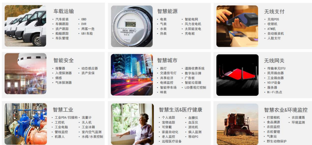
图 公司产品主要应用场景