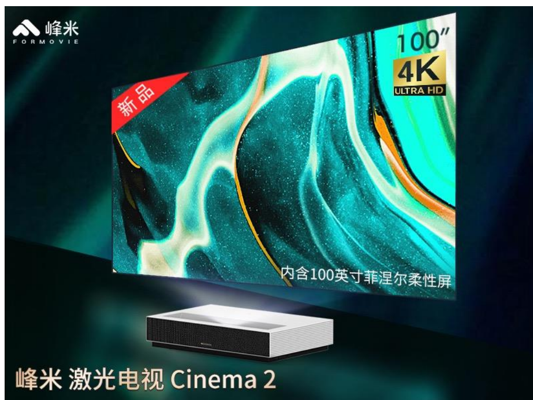
图 3：峰米激光电视新品 Cinema 2

近几年激光电视、智能微投等家用投影产品得到了快速发展，既得益于消费者对新观影模式的接受度不断提高，也受益于产品成本与价格的快速下降，而产品性能却不断提升。公司家用产品市场份额领先，家用板块业务快速增长。