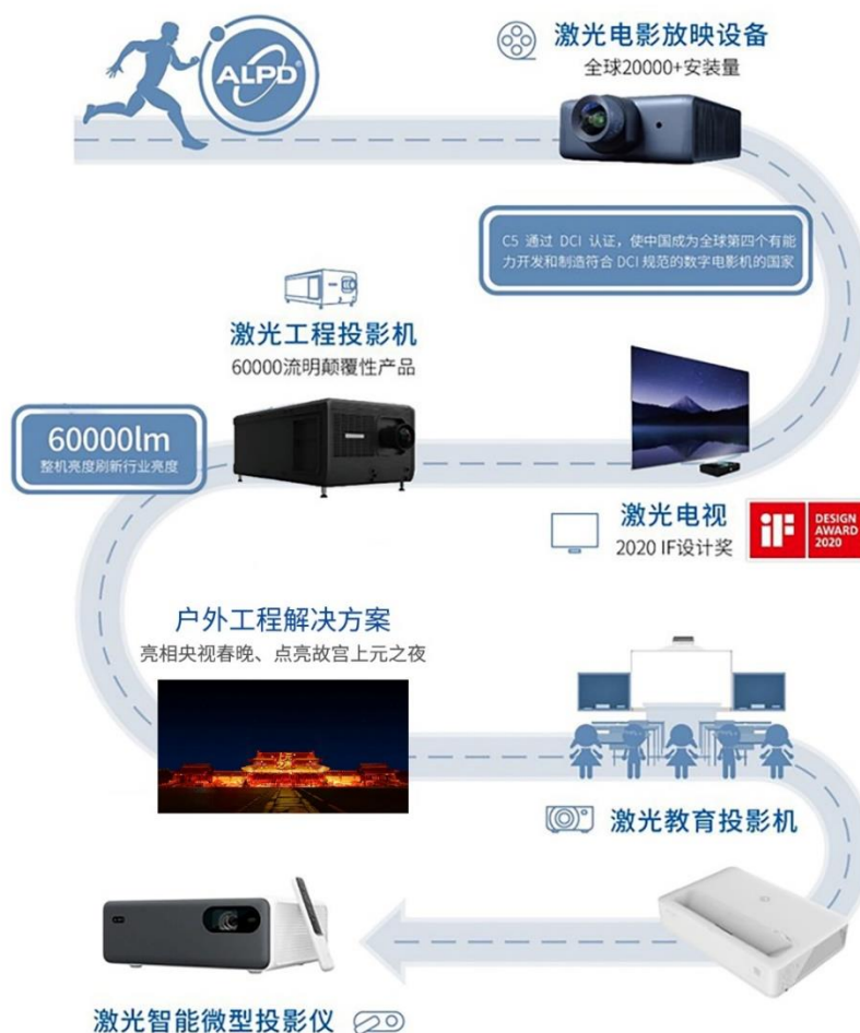
图 1：ALPD®激光显示技术及其应用发展