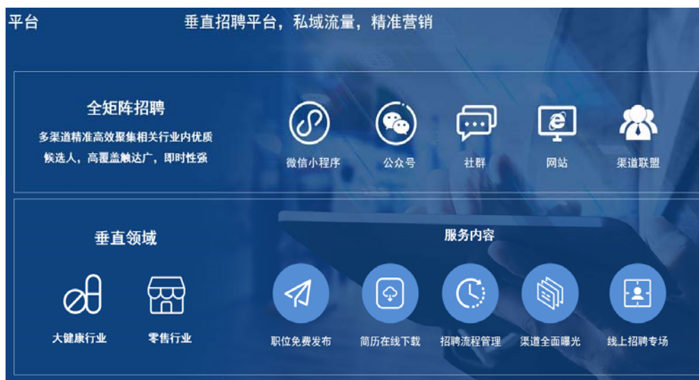
图2：人力资源管理SaaS平台