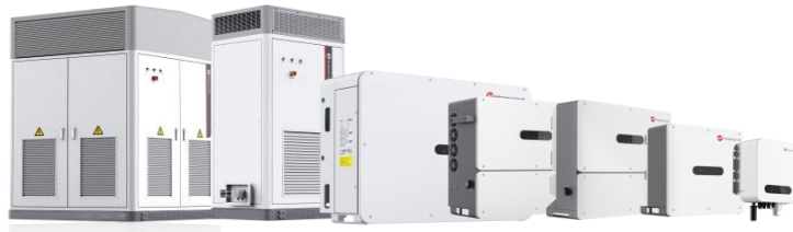
集中/集散式大功率光伏发电逆变器和 3kW~225kW 的组串式光伏逆变器

3、在电气传动方面，禾望电气在强大的定制工程型风电变频器平台基础上，自主研发了 HD2000 系列低压工程型变频器、HD8000 系列中压多电平变频器和 HV500 系列高性能变频器，此外，禾望电气还拥有 HV300 系列通用变频器，油田专用 HEC 系列变频器，禾望电气的工业传动产品涵盖各个功率段及多种控制方式，适用于冶金轧钢、石油石化、矿山机械、港口起重、分布式能源发电、大型试验测试平台、海洋装备、纺织、化工、水泥、市政、轨道交通等高端工业行业应用领域。