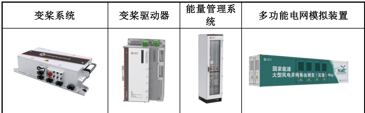
智能运维服务产品如下图所示：