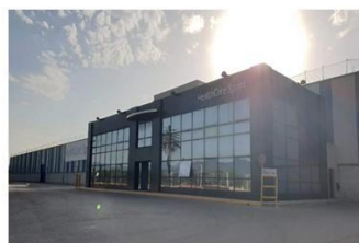
西班牙工厂·设计产能8-10亿人民币