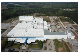
美东工厂·设计产能8-10亿人民币