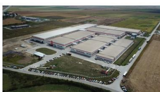
塞尔维亚工厂·设计产能8-10亿人民币