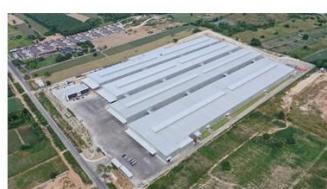
泰国工厂·设计产能8-10亿人民币