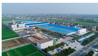
中国工厂·设计产能60亿人民币

前瞻性的全球产能布局使得公司在未来的市场竞争中具备快速调动全球资源的先发优势，提高公司抗风险能力。本次反倾销初裁前，公司即充分利用灵活的产能资源，作出相应调整：美国市场涉及反倾销部分的产品由美东美西本土生产基地、西班牙生产基地供货，受反倾销影响有限。