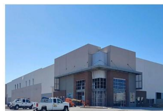
美西工厂·设计产能8-10亿人民币