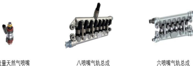
大流量天然气喷嘴