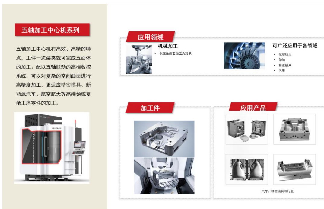
图2-1 五轴加工中心系列产品及应用图示