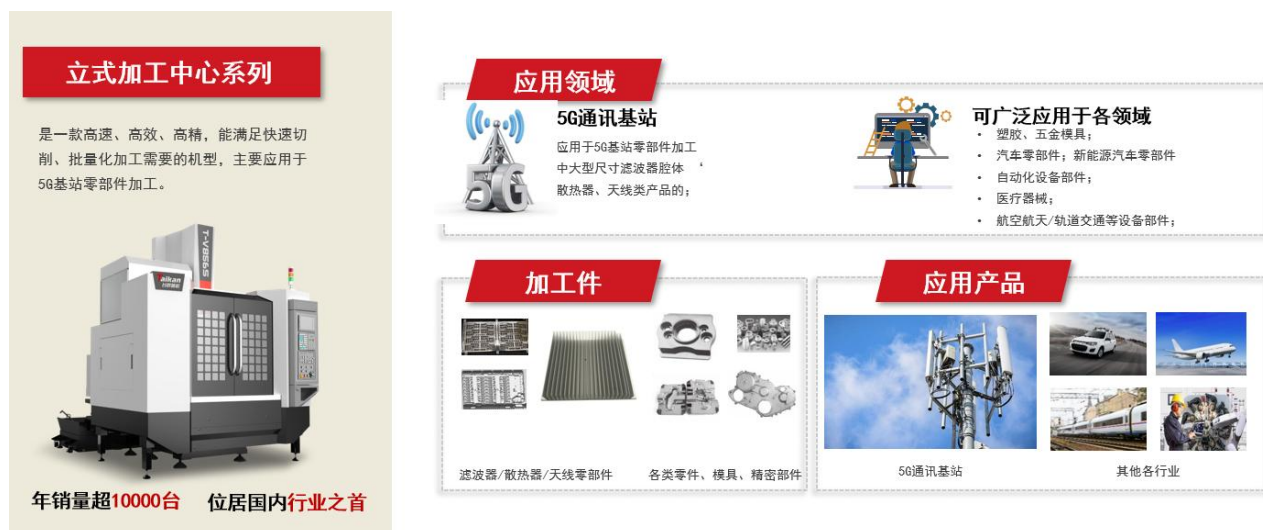
图2-2 立式加工中心系列产品及应用情况图示

通用系列产品下游应用领域广泛，为满足不同细分领域多样化的加工需求，除核心产品立式加工中心外，公司对通用系列产品进行了多序列的技术和产品布局，涵盖龙门加工中心系列、卧式加工中心系列、数控车床系列等，并在汽车零部件、自动化设备及机器人、机械加工、模具加工、零件加工、航空航天、轨道交通、医疗器械等领域广泛应用。