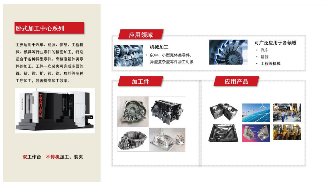
图2-4 卧式加工中心系列产品及应用情况图示

主要应用于汽车、能源、信息、工程机械、模具等行业零件的精密加工，特别适合于各种异型零件、高精度箱体类零件的加工。工件一次装夹可完成多面的铣、钻、镗、扩、铰、铤、攻丝等多种工序加工，显著提高加工效率。