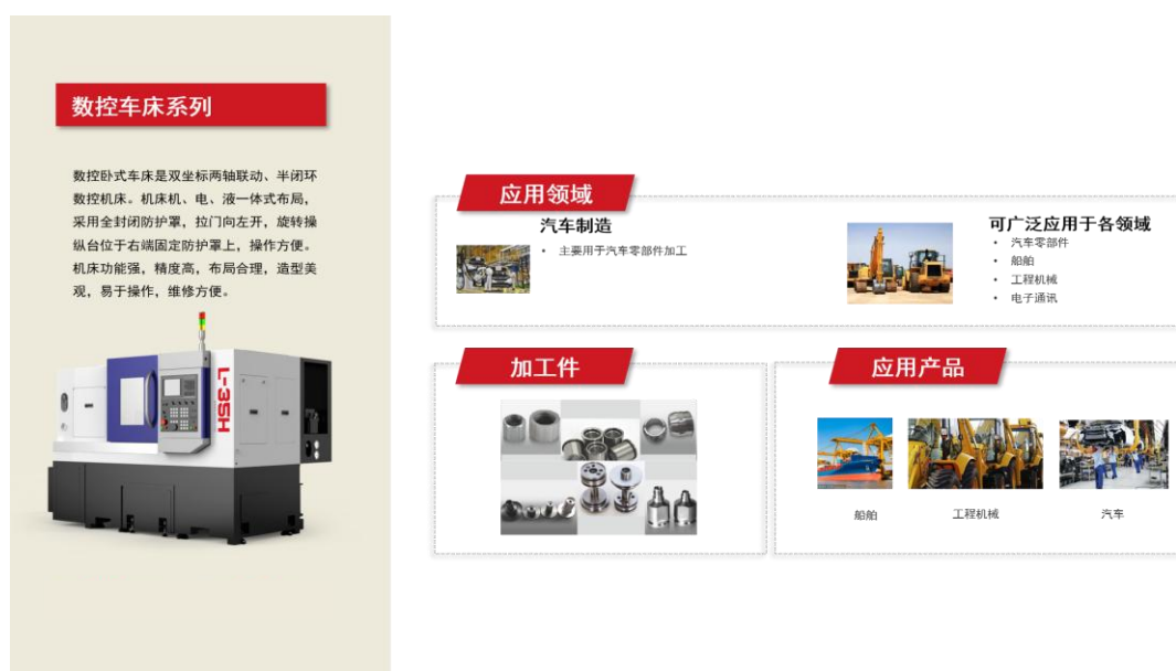
图2-5 数控车床系列产品及应用情况图示

数控卧式车床是双坐标两轴联动、半闭环数控机床。机床机、电、液一体式布局，采用全封闭防护罩，拉门向左开，旋转操纵台位于右端固定防护罩上，操作方便。机床功能强，精度高，布局合理，造型美观，易于操作，维修方便。