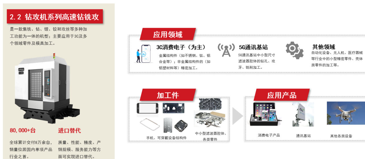
图2-6 高速钻铣攻牙系列产品及应用图示（第六代）

2021年以来，针对钻攻机产品，公司基于在技术端和商务端的快速应对能力，在传统3C应用领域的基础上，积极推进3C产品的非3C化应用，面向新兴领域市场旺盛的需求，积极开拓无人机、电子烟、VR/AR硬件、智能家居、高端医疗、新能源汽车等相关零部件的金属加工领域，使公司发展赛道进一步拓宽，成为公司3C业务的重要补充。