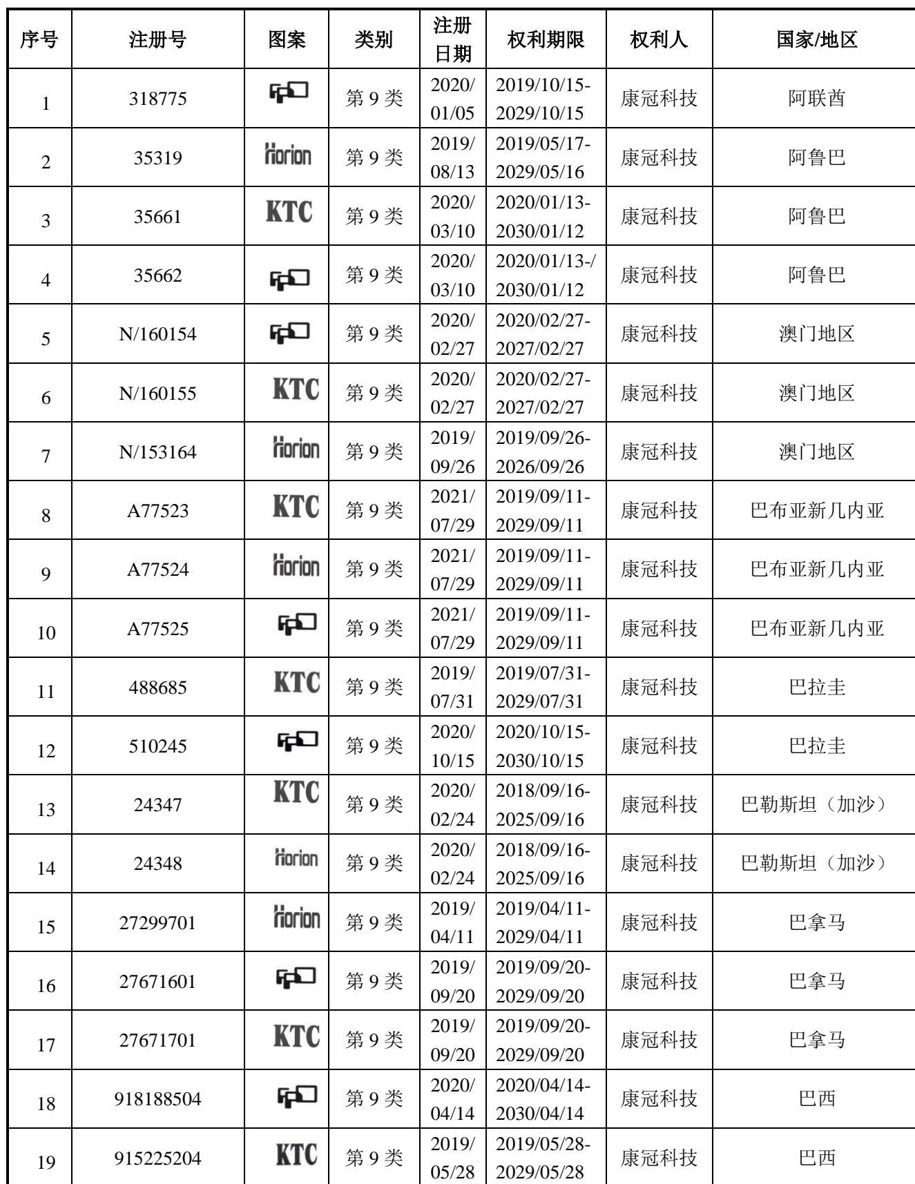
附件一：发行人及其子公司的境外商标（截至 2021 年 12 月 31 日）