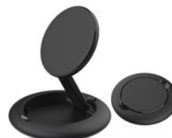
可折叠磁吸式无线充电器