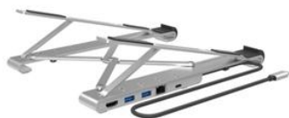
电脑支架嵌入Type-C转换器