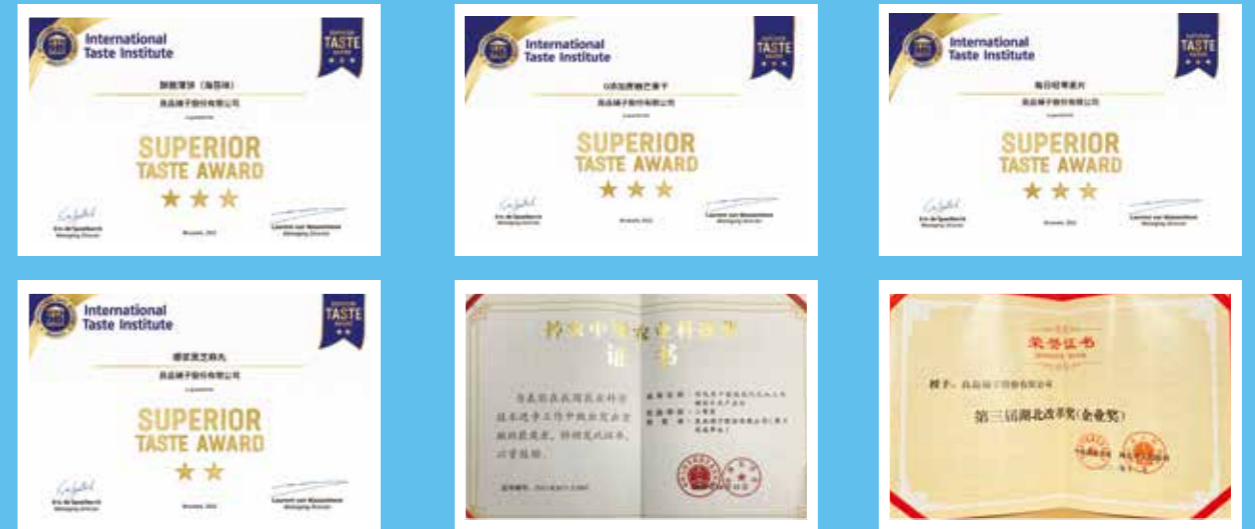
以下为 2021 年良品铺子获得的部分荣誉奖项

良品铺子先后三次荣获“顶级美味大奖”，该奖项由米其林主厨、食品鉴师、营养师等组成的评审团评选，2021年共有8款产品获星级奖章，紫衣腰果、酥脆薄饼（海苔味）、每日轻零麦片、0添加蔗糖芒果干获颁 Superior Taste Award 美味奖3星奖章，成为中国美食新名片。