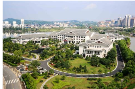
江西庐陵岭南东方宾馆