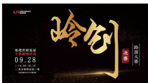
岭南控股创新路演大赛

岭南控股把握疫后新消费趋势，大力推动支持下属子公司创新产品和服务，不断拉近“供给侧”与“需求端”的距离，激发业务单元的市场活力和创造力。