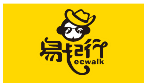
易起行信息技术创新项目