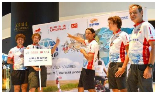
太阳之旅中法自行车拉力赛