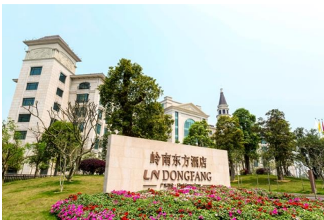
广东四会岭南东方宾馆

夯实老字号品牌文化传承的现实基础，聚焦年轻消费群体，提升老字号品牌在消费者心中的品牌认可度，在推动体制机制创新上实现更大突破，激发老字号品牌新活力。公司坚持“走出去”战略，充分发挥自身产业链的综合优势，主动延伸布局至旅游目的地、高铁沿线、三线城市，以老字号广州东方宾馆为核心的岭南东方品牌已覆盖 15 城，形成有规模、高质量的品牌输出。