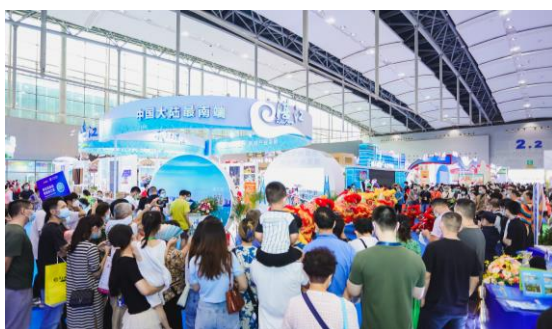
广东国际旅游产业博览会