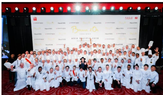
博古斯世界烹饪大赛亚太赛和中国赛

疫情形势下的“安心会议”标准模式，将广东国际旅游产业博览会打造为全国规模最大、国际化程度最高、市场化运作效果最好的专业性旅游博览会品牌之一。