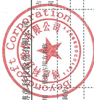
2021年度非经营性资金占用及其他关联资金往来情况汇总表