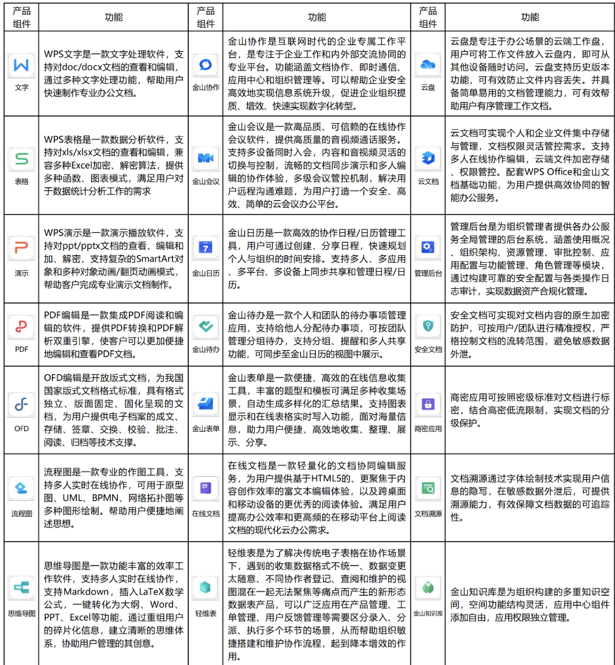
金山办公能力产品矩阵主要组件

上述两款产品涵盖的主要应用功能构建了金山办公能力产品矩阵，其主要产品及功能情况详见下图。