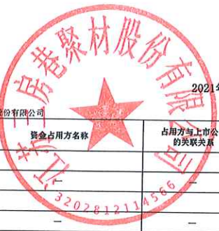
2021年度非经营性资金占用及其他关联资金往来情况汇总表