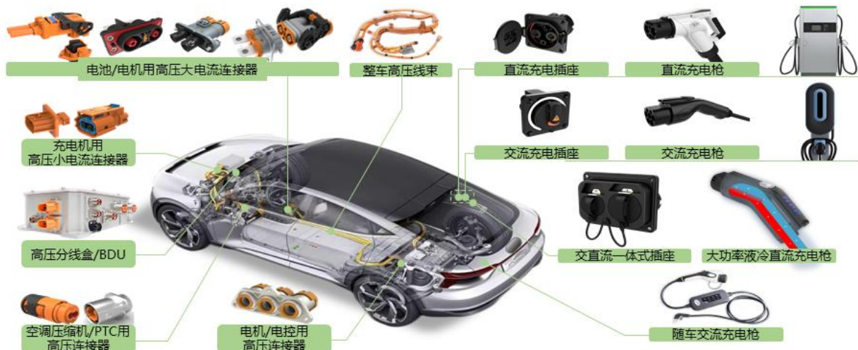
公司新能源汽车产品应用示例

公司车载与能源信息板块产品包括高压连接器及线束组件、高压分线盒（PDU）/BDU、充/换电接口及线束、交/直流充电枪、大功率液冷直流充电枪、通讯电源/信号连接器、储能连接器、高速连接器等，其中车载产品为新能源汽车提供高压、大电流互联系统的整体解决方案，并已进入比亚迪、吉利、长城、上汽、一汽、广汽、北汽、本田等国产一线品牌及合资品牌供应链体系；能源信息产品主要应用于通信基站及各类通信网络设备和储能设备等，配套服务于华为、中兴通讯、大唐移动、维谛技术等公司。