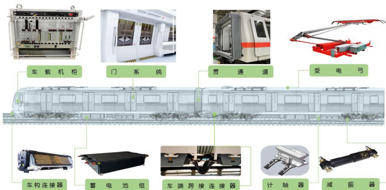
公司轨道交通产品应用示例

公司轨道交通与工业板块产品主要有：连接器、减振器、门系统、计轴信号系统、贯通道、受电弓、蓄电池箱等，主要应用在铁路机车、客车、高速动车、城市轨道交通车辆、磁悬浮等车辆及轨道线路上；配套供应于中国中车集团、中国国家铁路集团有限公司以及建有轨道交通的城市地铁运营公司。