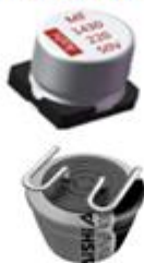
贴片式铝电解电容