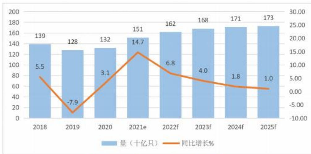
2018 年-2025 年全球铝电解电容器市场需求量发展与预测

根据中国电子元件行业协会信息中心的数据：预计 2021 年全球铝电解电容器需求量约为 1,510 亿只，同比增长 14.7%，到 2025 年将达 1,730 亿只，2020-2025 年五年平均增长率约为 5.6%。