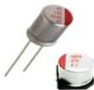
高分子固态铝电解电容 引线式、贴片式