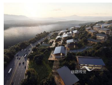
长江干部学院效果图