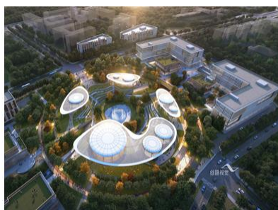
北京怀柔科学城城市客厅效果图