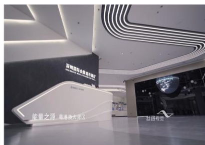
深圳国际会展城市展厅