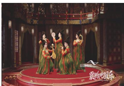
震撼吧国乐先导片