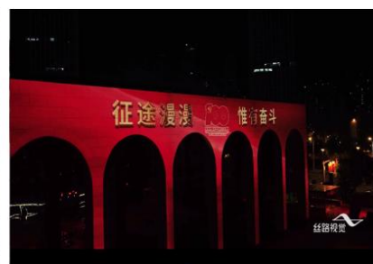
天津意风区光影秀