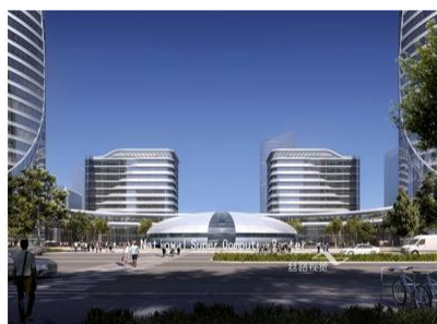
国家超算中心建筑效果图