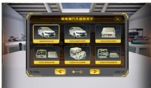
新能源汽车虚拟教学