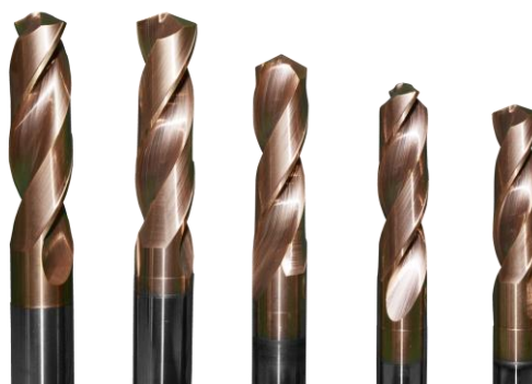
硬质合金整体刀具

可转位刀具是将刀体（刀盘/刀杆）与刀片采用机械装夹方式组合的刀具。我国存在刀体企业和刀片企业各自独立生产的局面，如果不能有效的解决刀片与刀体的适配性问题，就无法满足客户对刀具性能的更高要求。公司紧跟行业发展趋势，拟提高数控刀具供应和配套能力，从而提升公司刀具产品性能和市场竞争力，扩大市场份额。