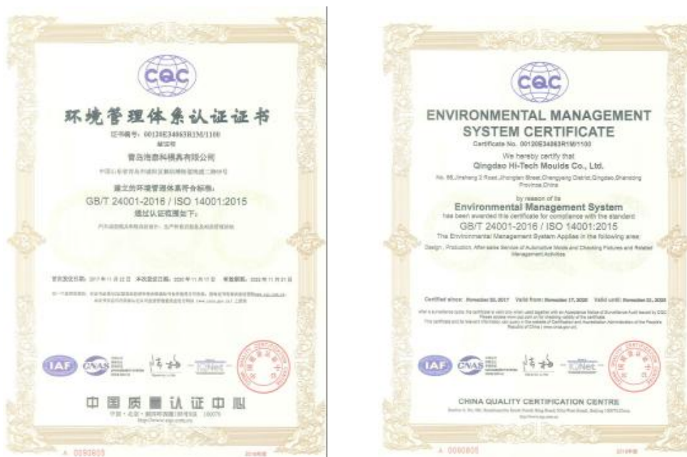
公司 ISO 14001 体系证书

公司自设立起高度重视环境保护工作，推进清洁生产和循环经济的绿色发展战略。公司十分注重技术节能降耗、减排的发展思路，在生产中不断进行工艺改进以提高能源的循环使用或减少“三废”的排放。公司配置了可靠的环境保护设施，并提高运行质量与效率，且制定和落实了环保管理方案和控制措施，有效降低了公司生产过程中对环境的影响。公司于 2016 年末搬迁至现厂址，新厂房设计规划考虑了节能环保、工艺优化、减少浪费等因素，在生产、办公过程采取了一系列的节能减排措施，其具体内容及节能效果评估如下：