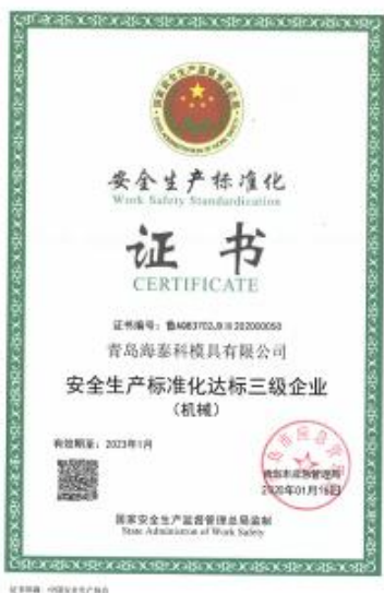
安全生产标准化达标三级企业