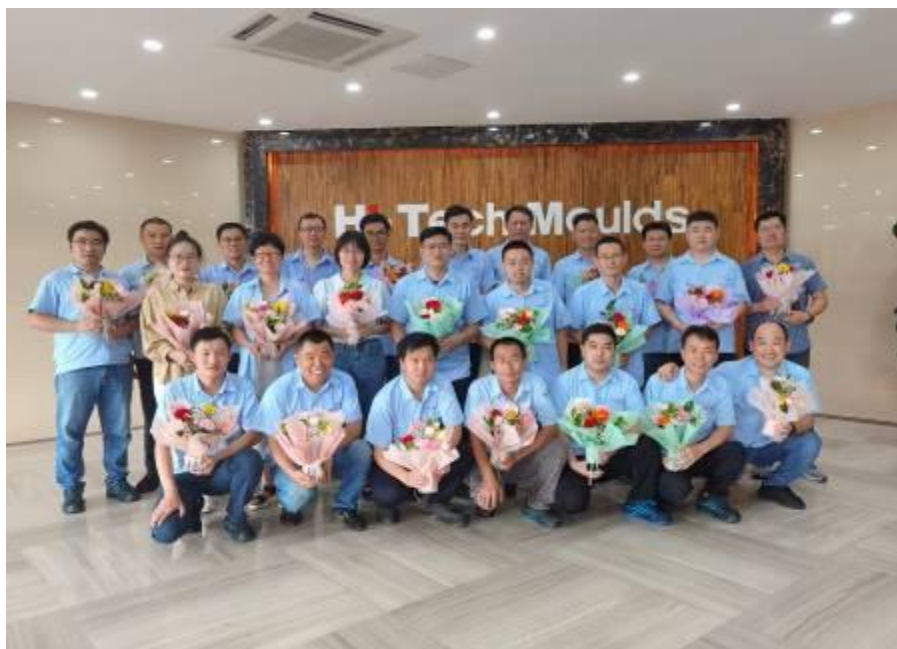
培训讲师教师节留影