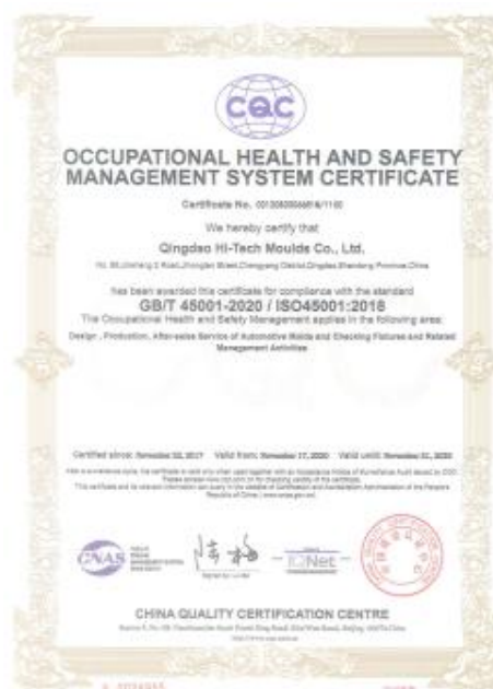
公司 ISO 45001 体系证书