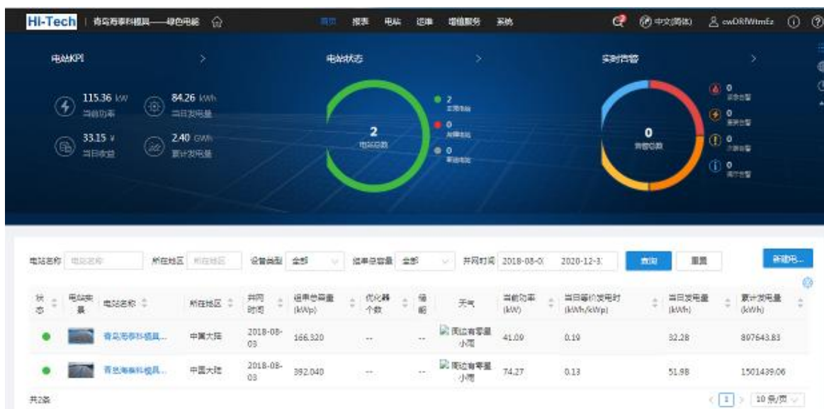
公司光伏电站管理界面

公司积极引进清洁能源发电项目，在现有厂房屋顶铺设了光伏发电组件，将太阳能转换成电能，并网发电，光伏发电设备于 2018 年 8 月投入使用。截止 2021 年 12 月 31 日，累计并网发电量为 248.39 万千瓦时，等效节约标准煤量 1,003.92 吨，等效二氧化碳减排量 1,743.80 吨。