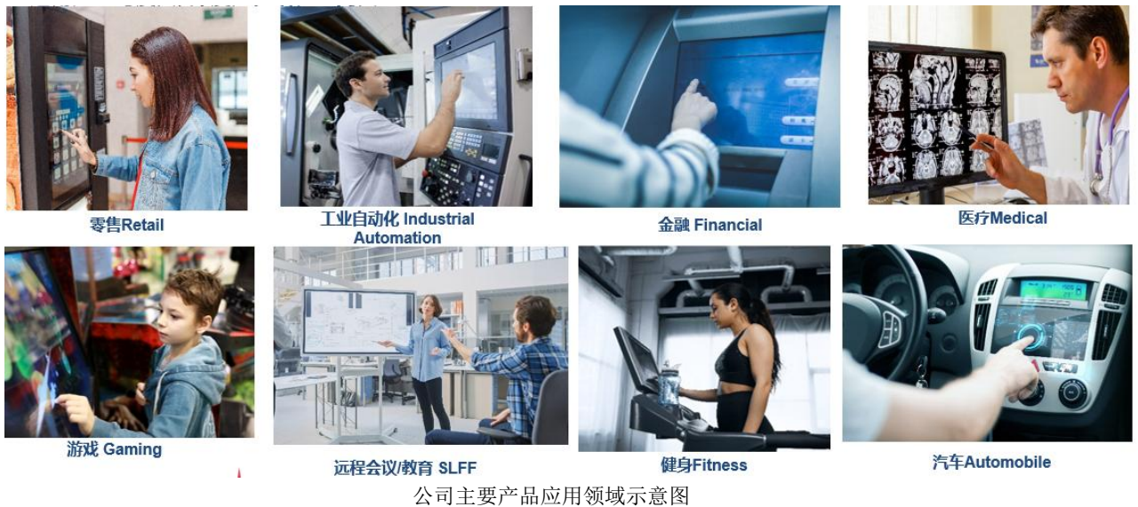
公司主要产品应用领域示意图

公司产品已经广泛应用于零售、金融、工控、医疗、博弈、智能健身、快递物流、交通运输、公共事业等终端应用领域，其中，零售为当前公司产品主要应用领域，其次为金融、工控领域。随着公司收购台湾龙星科技项目和投资鸿通科技项目的实施，公司产品应用领域将进一步拓展至远端会议和车载智能座舱领域。