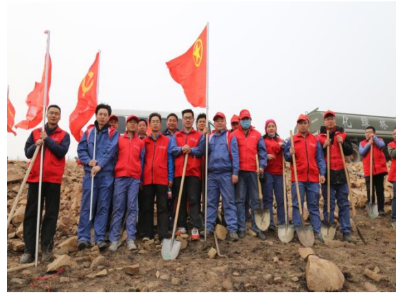
青春共建绿色和谐”春季义务植树