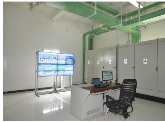
电镀废水处理动态可视化平台