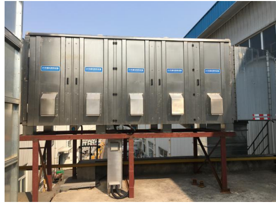
涂装废气 UV 光氧催化及活性炭吸附装置