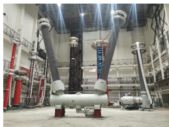
800 千伏罐式断路器产品