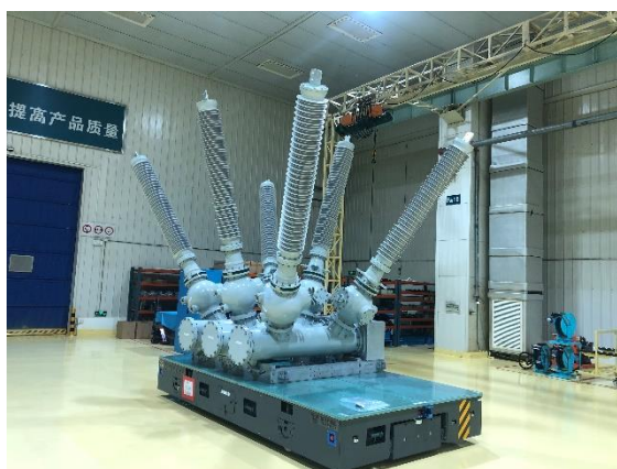
170 千伏 HGIS 产品

2021 年多项新产品实现技术突破，解决了 800 千伏单屏蔽套管技术、套管与断路器共气室设计及工艺难点，研制 800 千伏罐式断路器并具备工程推广条件。攻克了 2500A 投切滤波器大组容性电流开合问题，研制具备 22 次电寿命试验开断能力的 550 千伏 GIS 用断路器并应用于湘润变工程。研制的 363 千伏 GIS 补全公司 GIS 产品系列，助力西北市场开拓。攻克了断路器弹簧机构直动技术，研制的 252 千伏紧凑型 GIS 应用于商丘沙盟变。突破了 126 千伏双动自能式灭弧室的通流极限，研制了新一代 126 千伏 GIS 并具备量产条件。攻克了高温、重污秽及高海拔等运维难题，研制的 550 千伏滤波器组断路器已在陕武工程投运。完成 170 千伏 HGIS 研制，提升了欧洲市场的整体供货能力。研制了 800 千伏高参数直流隔离开关，解决了白鹤滩-江苏特高压工程高海拔、重污秽问题并实现工程量产。