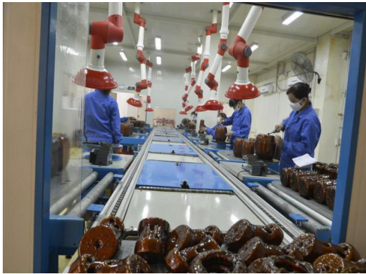
电镀件环保型可循环遮蔽材料应用