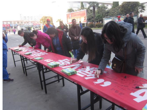
争做绿V客绿色齐分享