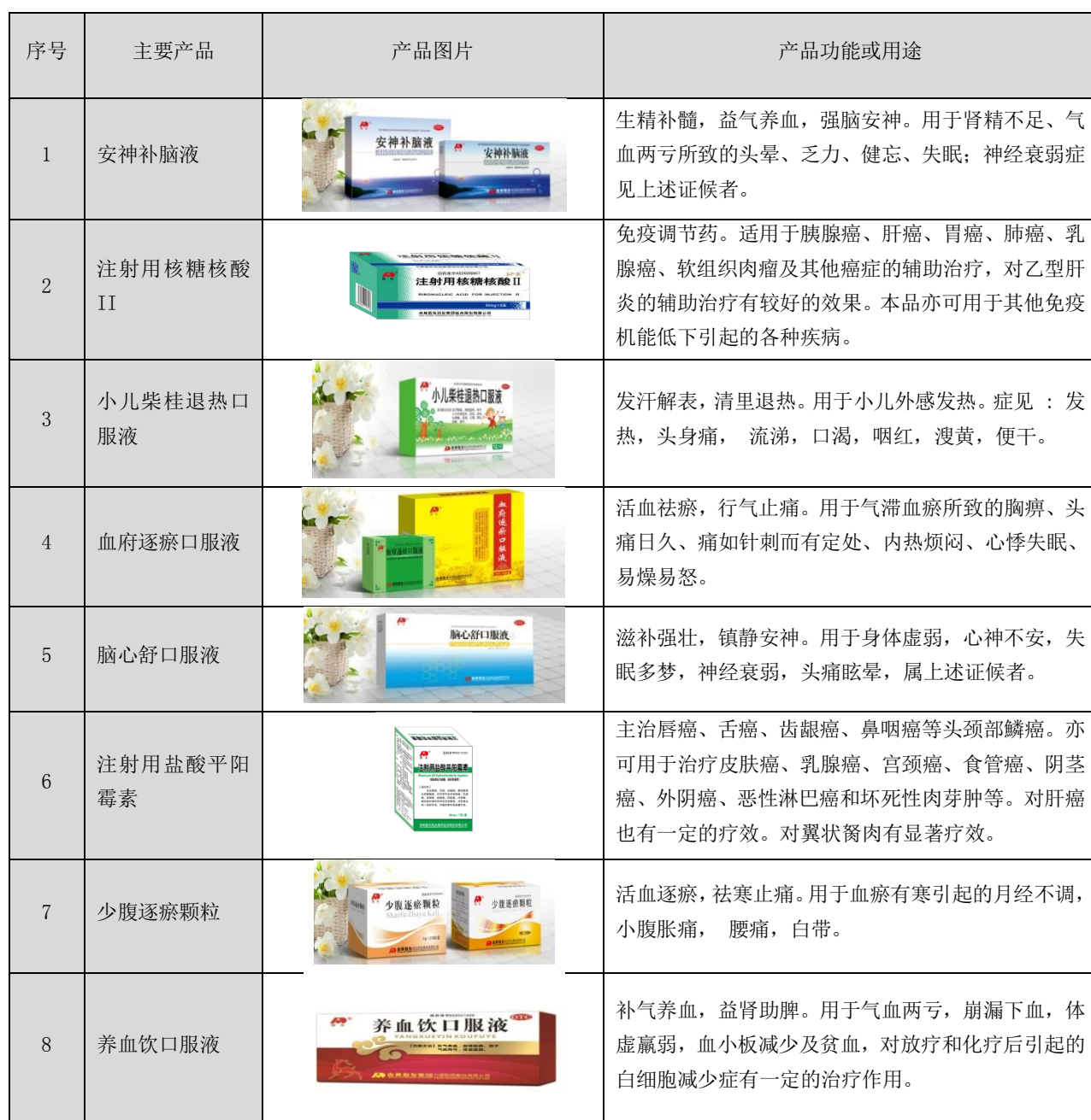
表 2：公司主要产品目录