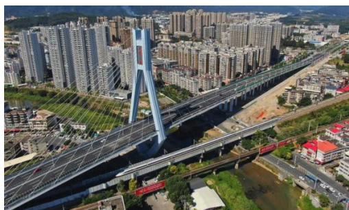
图6：NCC桥梁钢结构应用于跨线桥