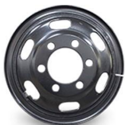
图1：型钢钢轮（适用于特殊路况重载车型）