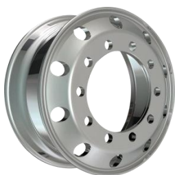
图3：锻造铝合金轮毂（适用于高端商用车型、新能源车型、特种车辆）