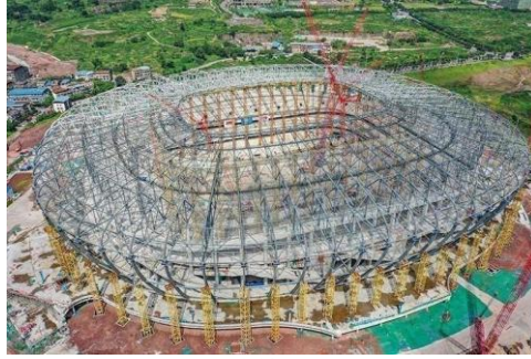
图8: NCC钢结构应用于体育场馆