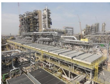
图5：NCC石化钢结构应用于炼油领域

公司的钢结构业务主要为钢结构的设计、制造和安装为主，配套金属围护系统为辅。产品类型主要包括建筑钢结构、设备钢结构以及钢结构桥梁三大类产品，公司着重深耕石化/设备钢结构工程、市政/桥梁及轨道交通、大型高端工业厂房、高层钢结构建筑等四大细分领域的钢结构业务，尤其是在石油炼化及化工的钢结构制造具有独特的优势。经过二十多年的发展，公司已经在钢结构领域建立了“新长诚”“NCC”的品牌影响力。