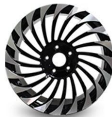
图4：乘用车锻造铝轮（新开发产品，适用于改装车）