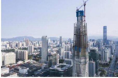
图7: NCC钢结构应用于超高层建筑