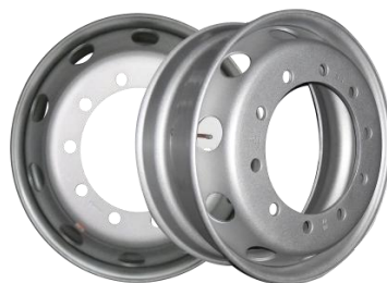
图2：轻量化无内胎钢轮（适用于轻量化商用车型）