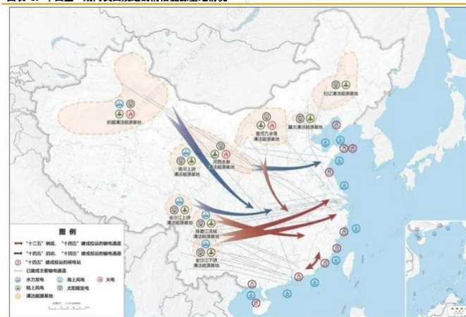
图表 1: “十四五”期间我国规划的清洁能源基地情况

2021 年，全国各省的“十四五”规划陆续出台，针对未来光伏、风电基地的建设规划，九大清洁能源基地涉及的省份均出台了相关规划。据不完全统计，九大清洁能源基地涉及省份规划的光伏、风电建设规模超过了 200GW。