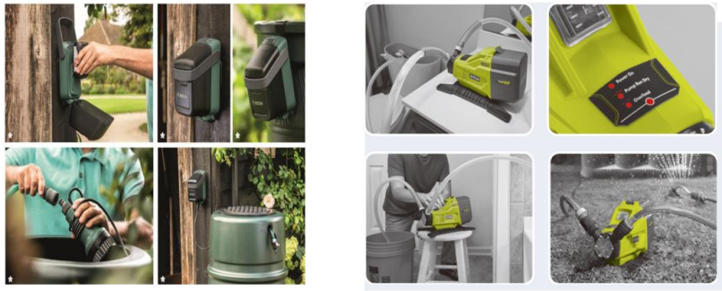
图 5 产品应用场景展示