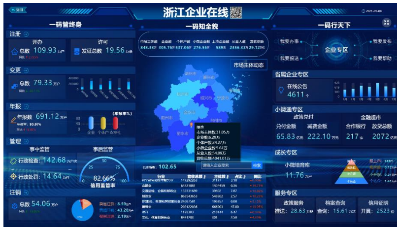
“浙江企业在线”政企互动平台

在智能民生领域，作为全国最早的社保及医保信息化服务提供商之一，公司不断深化拓展养老、社保、医疗等健康和民生保障业务，为其构建硬件和软件应用平台，提供信息系统开发、建设、运维等全面解决方案。业务涵盖智慧人社、智慧医保、劳动就业、人事人才、退役军人、智慧助残、健康大数据等方面，主要产品有社会保险管理省（市）集中、智慧医保管理与服务系统、就业管理与服务信息系统、国家及多地的农民工工资监管系统、劳动关系运行管理平台、大数据分析与服务平台、移动医疗支付等解决方案。