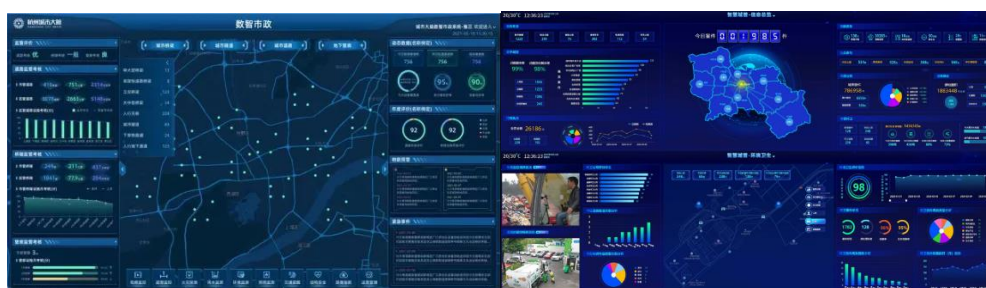
数智市政平台&智慧城管平台

● 数字政府业务涵盖智慧监管、智慧城管、智慧公安、电子政务等领域，是以新一代信息技术为支撑，助力政府进一步优化调整内部组织架构、运作程序和管理服务，全面提升政府在经济调节、市场监管、社会治理、公共服务、环境保护等方面的履职能力。