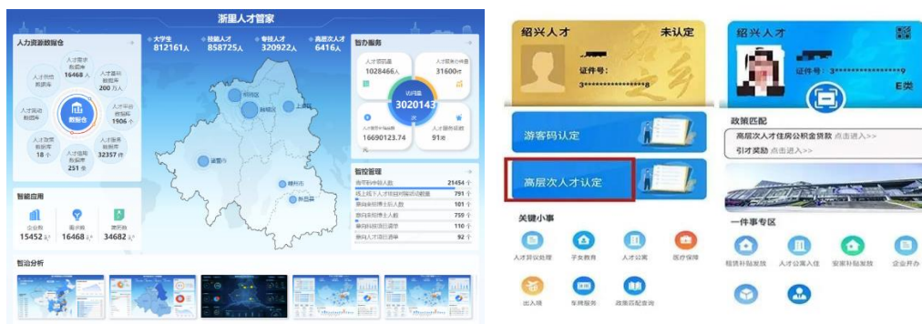
浙里人才管家&人才码