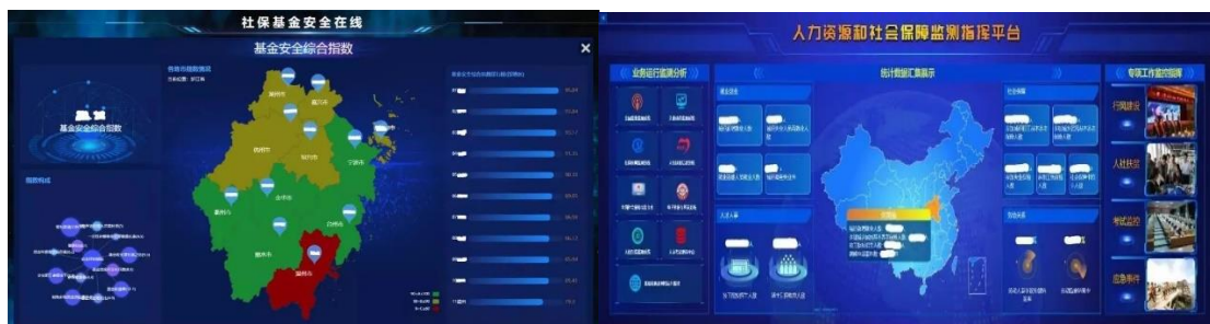
社保基金安全在线&人力资源和社会保障监测智慧平台

在智能民生领域，作为全国最早的社保及医保信息化服务提供商之一，公司不断深化拓展养老、社保、医疗等健康和民生保障业务，为其构建硬件和软件应用平台，提供信息系统开发、建设、运维等全面解决方案。业务涵盖智慧人社、智慧医保、劳动就业、人事人才、退役军人、智慧助残、健康大数据等方面，主要产品有社会保险管理省（市）集中、智慧医保管理与服务系统、就业管理与服务信息系统、国家及多地的农民工工资监管系统、劳动关系运行管理平台、大数据分析与服务平台、移动医疗支付等解决方案。