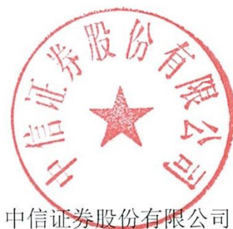
中信证券股份有限公司