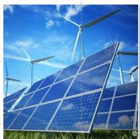
光伏、风力发电及储能