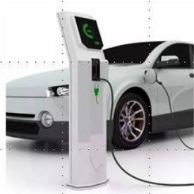
新能源汽车及充电桩