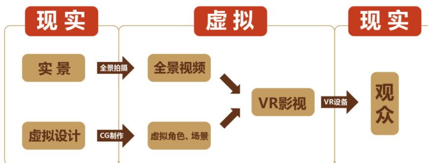
（图 8：VR数字影像内容生产过程）

VR与CG内容制作生产流程是公司产生原创叙事创意（idea），或与原始IP版权方（文学作者、漫画作者等）就改编权、摄制权达成授权协议后，经过适当的文学创作与视觉开发过程，在前期形成可用于实拍拍摄、动画、互动游戏改编的文学剧本、概念设计、玩法设计、关卡设计、分镜故事板，在中期由制作团队完成美术资源和镜头制作，再将初步成型的数字中间影像（DI）/游戏原型（prototype）经由后期的剪辑、调色、后处理、配乐、音效的润色修饰，最终形成可商业传播的影视或互动游戏作品。公司可按照投资比例或协议的约定取得著作权收入、制作收入或代理发行收入。而内容生产过程中沉淀的创作生产经验、计算设备硬件、流程工具软件以及数字资产积累，不仅具有降低同类型内容投资风险、提高收益率的作用，还具有一定的直接变现价值。