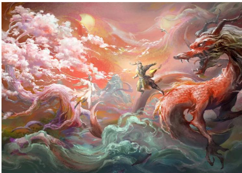
(图 2: 金庸“射雕三部曲”主题体验馆设计效果图)