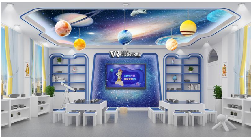
(图 4: VR未来教室效果图)

属公司东方梦幻联合中国国家地理，精选《本色中国》中的高品质VR素材，推出VR图书《给孩子的中国国家地理》，2021年6月已由中信出版集团出版发行。在儿童科普类图书中融入VR技术，是把地理这种典型的综合性学科与先进科技强势相加，实现静态文字和图片内容与VR全景穿越画面的完美结合，解决科普类图书的呆板性、互重性，增加了趣味性，增强青少年对世界的好奇心和探索欲。