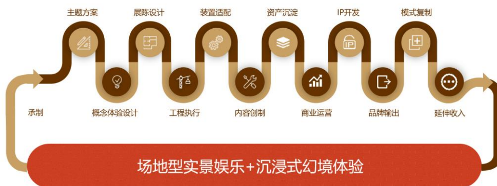
（图 7：LBE项目经营模式示意图）

理、项目开发模式等全产业链一站式服务。合作模式上，公司有定向咨询服务、项目设计委托、EPC单体项目交钥匙工程、OM运营委托、EPCO模式、FEPCO项目融资模式等。