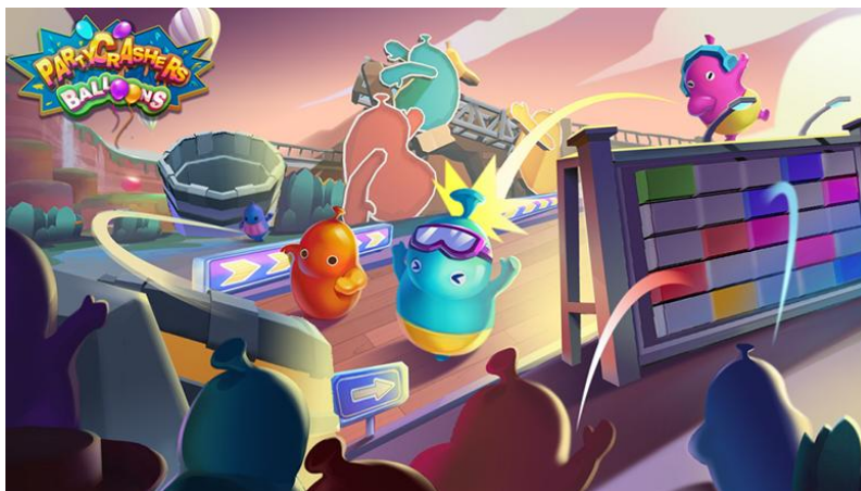
(图 3: "Party Crashers: Balloons" (《气球大作战》) 效果图)

VR娱乐方面，针对VR一体机市场的快速发展，公司打造的大型武侠类VR游戏《醉铁拳VR》因势利导，逐步调整运营方向，从用户较少的海外PC VR平台——Steam VR平台转向快速增长中的国内线上线下平台运营；同时顺应市场需求，调整研发策略，暂缓大型重度游戏开发进程，针对VR一体机机能低于PC VR平台及非硬核用户多的特点，启动多人PvP游戏《气球总动员》（英文名称：Party Crashers: Balloons）的研发，力争命中轻度VR游戏群体；另外研发团队通过VR技术与剧本杀产品的结合，在2021年下半年启动了VR剧本杀项目《失落的王朝》，该项目初期测试版本在南昌举办的2021世界VR产业大会上，得到了媒体、体验用户的瞩目与好评。