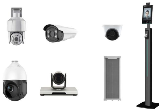
(图 6：安徽赛达的云视频会议产品终端、云视频监控产品终端及物联网广播终端)

云视频会议产品平台基于云端部署，能够兼容主流品牌、多档次视频会议终端，为用户提供高清视频会议媒体流分发、会议调度和管控等功能，并支持对接传统视频会议系统（设备利旧），满足不同用户和不用场景（固定会议或移动化场景）的应用需求。