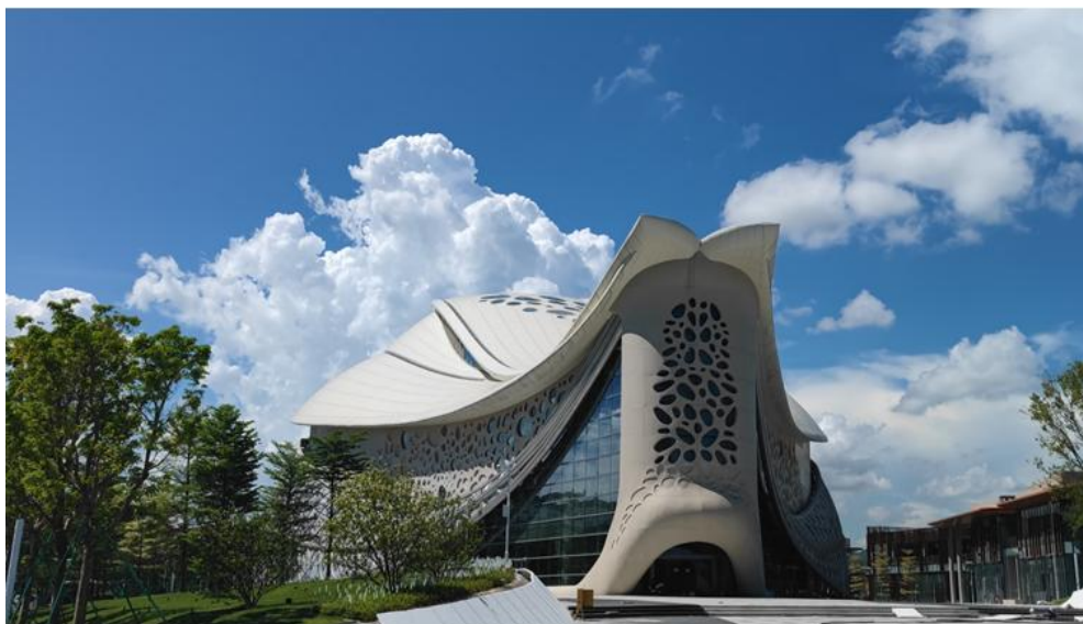
(图 1：珠海横琴中医药科技创意博物馆项目实景图)

珠海横琴中医药科技创意博物馆项目，是公司打造的以中医药技术及中医药植物为主题的沉浸式叙事体验馆，通过CG、VR、互动装置、全息成像、巨型雕塑、微缩模型等手段实现感官的沉浸，带领游客离开繁碌的现代社会，穿越到神奇的中医药世界，体验中医药文化的神奇魅力。