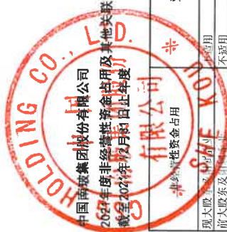
中国南玻集团股份有限公司 2022年度非经营性资金占用及其他关联资金往来情况汇总表 截至2022年12月31日止年度 非经营性资金占用