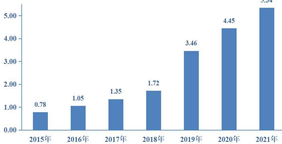
全球可穿戴设备出货量（亿台）