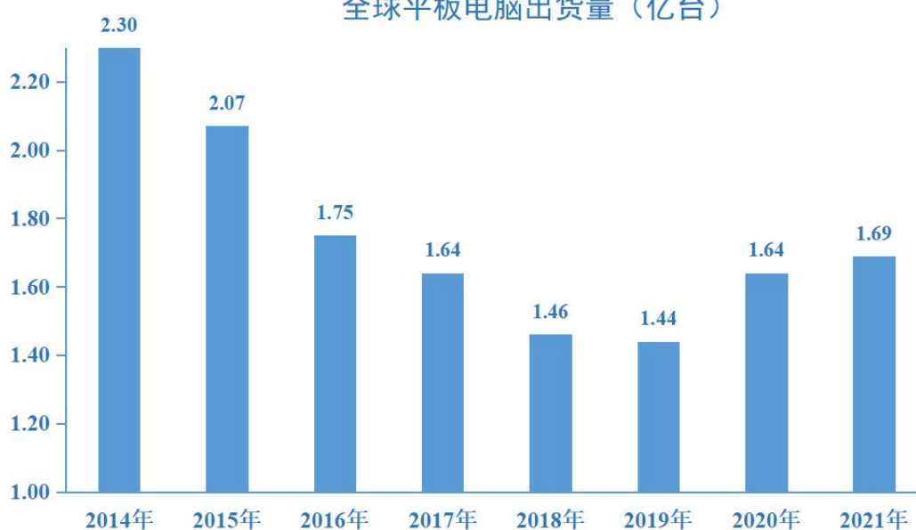
全球平板电脑出货量（亿台）

随着智能手机趋向大屏化，智能手机功能与平板电脑的重合性以及笔记本电脑走向超薄超轻，对全球平板电脑的市场前景有一定影响。不过，受新冠疫情推动，在线教育和居家办公需求激增，2020年全球平板电脑出货量达1.635亿台，较2019年的1.44亿台增长了13.54%。2021年全球平板电脑出货量达1.688亿台，较2020年又增长了3.24%。随着各手机厂商陆续进入平板市场，原有参与者也不断加大相关投入，将会继续促进平板电脑市场的持续增长。