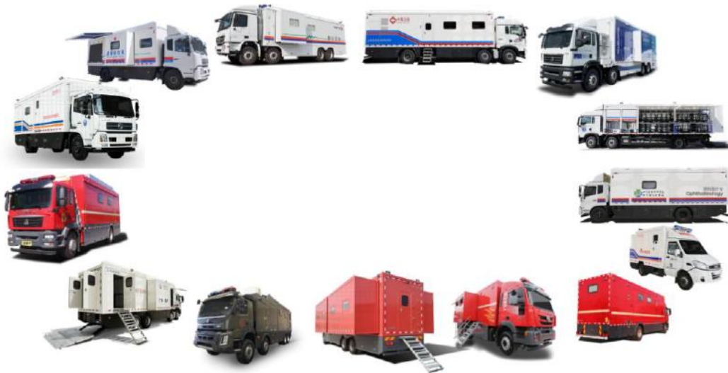
移动医疗保障装备示意图

移动医疗装备是公司多年战略培育板块，经过多年探索发展，凭借保障装备领域研发技术优势，产品性能达到市场领先，受疫情影响，市场需求旺盛，已受到多家医疗机构认可，该业务是公司重要的潜力板块。移动医疗装备从开始的单一产品（体检车）发展到至今，现已形成检验、影像、门急诊、手术、重症监护、防疫、后勤保障七大作业单元，具备先进的设计理念、成熟的制造工艺以及强大的特殊舱体研发能力，目前已经成为业内领先的方舱医疗车专业制造厂家，产品涉及6个系列10种型号，在健康体检车、手术车、移动生物实验室（检测车）、卒中救护车、CT检查车、微增压氧仓车等产品市场具有优势。现已具有配置全科甲级移动医疗和医疗应急处置能力，产品也正在向高端智能方向发展。