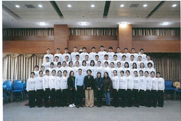
公司 2021 年新员工培训