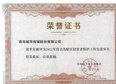
城市传媒荣获 2021 年度青岛辖区 投资者保护工作先进单位