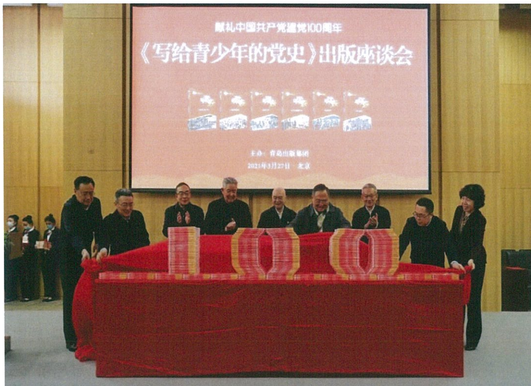
2021年3月26日，《写给青少年的党史》丛书出版座谈会在京召开

教育动员大会上关于“抓好青少年学习教育，让红色基因、革命薪火代代传承”的讲话精神，公司推进《写给青少年的党史》的出版发行，丛书得到从中央到地方各级宣传部门的高度认可，被新华社、人民日报等中央媒体广泛关注、广泛报道，获得山东省党史学习教育工作简报第26期的专刊报道，有声书入选2021年全国有声读物精品出版工程，系列专题片在央视播出，取得了社会效益和经济效益双丰收。