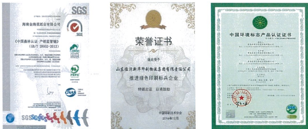
合作印刷厂家的绿色印刷资质

公司在相关产品出版印制过程中全面采用绿色印刷，使用植物型油墨，保证印刷品从原材料选择、生产、使用、回收等整个生命周期符合环保要求。在原材料选择方面，公司要求纸张供应商必须提供可持续森林认证证书即 FSC 或 FMC 资质，以满足图书纸张的环保要求。在印刷厂选择方面，公司认真落实国家规定，自 2012 年起，要求承担青岛版中小学教材印刷的厂家，必须具备实施绿色印刷的相关资质。