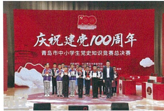
“学党史，讲好清廉故事”征文演讲 童心向党——青岛市中小学生党史知识竞赛