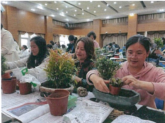
公司工会举办母亲节插花培训活动

公司以关爱员工身心健康、营造和谐的企业氛围为己任，关注员工工作与生活的平衡，倡导乐观向上、阳光活力的健康生活方式，并持续创新员工关怀举措，努力为员工提供力所能及的帮助。报告期内，公司举办职工心理健康知识讲座，职工权益法律知识讲座，“短视频主播大赛”，单身青年联谊活动，一线职工疗休养活动，职工健步行活动，花艺、绘画培训等多项活动，增强了员工的归属感、凝聚力和向心力。