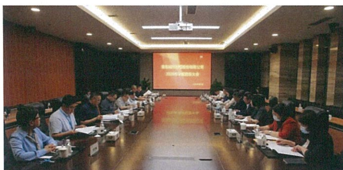
公司召开 2020 年年度股东大会暨 第九届董事会第十四次会议

根据证监监管部门要求，公司持续提高公司信息披露工作的质量和水平。报告期内，公司及时完成定期报告的编制与发布工作，密切跟踪公司董事会、监事会和股东大会决议事项完成情况，及时履行相关信息披露义务。严格做好内幕信息的防控工作，确保全体股东真实、准确、及时、完整地获取公司信息。截至 2021 年底，公司未发生股票价格异常波动情形及其他违法违规行为。