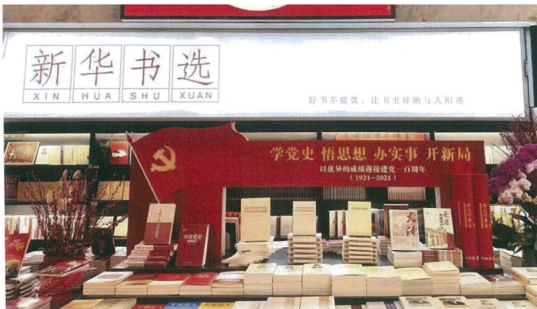
公司所属新华书店组织的“学党史 悟思想 办实事 开新局”主题图书展台

公司始终以高度的政治责任感和使命感，充分发挥新华书店主阵地作用，保证党和国家的重要文件、政治理论读物等重点图书在店内最醒目位置重点陈列，并进行广泛宣传。报告期内，通过举办“庆祝中国共产党成立 100 周年精品图书展”“‘四史’文献专题书展”等主题书展，倡导市民积极参与红色阅读，共同挖掘、保护、宣传红色阅读资源。公司新华书店各网点克服疫情的影响，坚持每天 12 小时的营业时间，全年共计营业约 27 万小时，全天候保障市民读者的阅读需求。