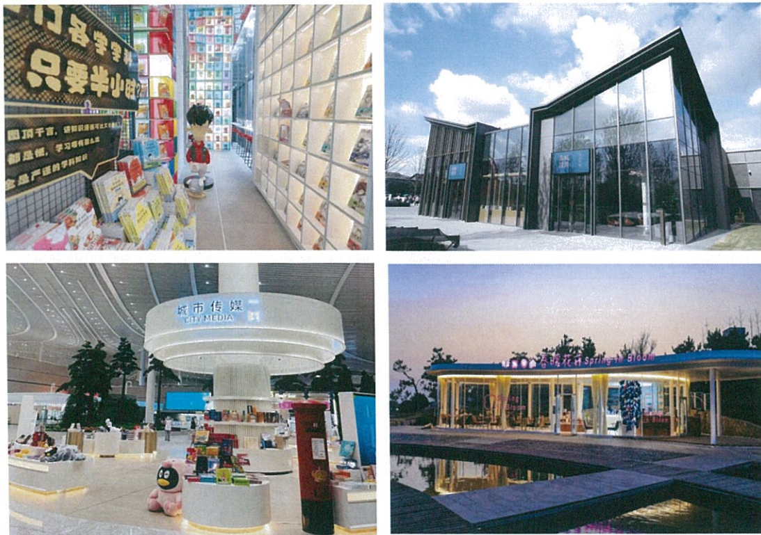
报告期内公司打造的特色文化空间展示

公司面向全国打造立体化、全场景式的新型文化空间，加快在特色文化空间领域的全面布局。报告期内，上海中心“混知文化综合体”、“春风习习”嘉兴南湖店、成都熊猫时空馆店、青岛春暖花开店、胶东机场店等多家特色文化空间落地，公司特色文化空间运营业务发展迅速。公司面向全国打造立体化、全场景式的新型文化空间，加快在特色文化空间领域的全面布局。报告期内，上海中心“混知文化综合体”、“春风习习”嘉兴南湖店、成都熊猫时空馆店、青岛春暖花开店、胶东机场店等多家特色文化空间落地，公司特色文化空间运营业务发展迅速。