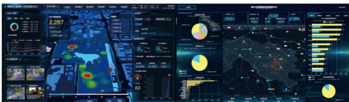
佛山市禅城区智慧城管项目

智慧多功能综合路灯杆是智慧城市的天然入口，受到国家政策和各级政府的大力支持。公司加大了智慧城市领域的市场、技术及产品布局力度。报告期内，中筑天佑与中国联通、浙大中控、中科院强强联合成立数字社区研究院，致力于充分利用5G、云计算、物联网和大数据，共同打造生态服务能力体系。2021年中标了佛山市禅城区智慧城市项目、湖北广水市数字化城市管理信息化项目，目前已基本实施完毕，后续将陆续向其他城市和区域复制推广，为公司培育新的利润增长点。