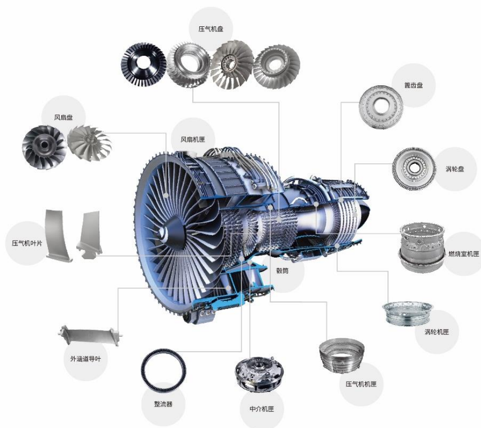
公司航空发动机零部件产品示意图