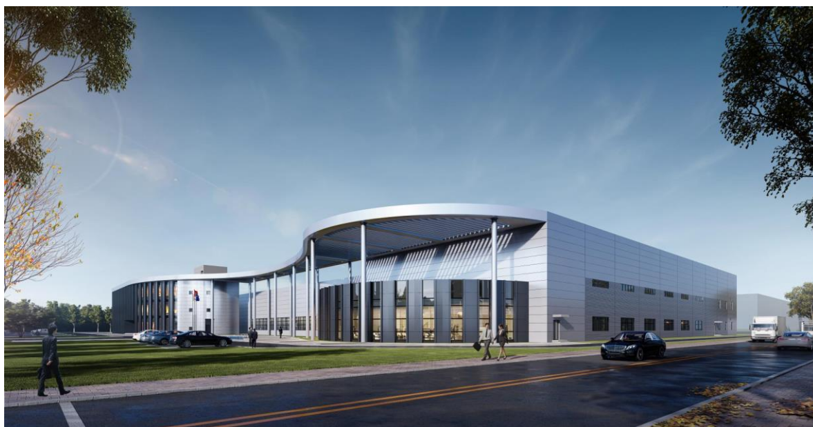
无锡三期工厂建设效果图