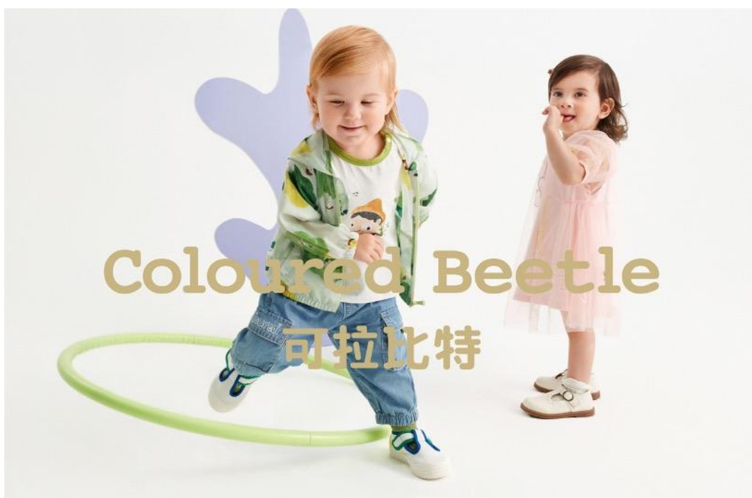
Coloured Beetle 可拉·比特 佛山南海区月湖环宇城店