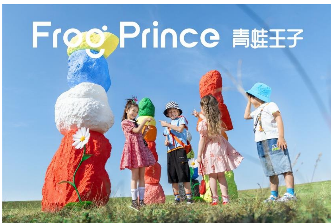
FROG PRINCE 青蛙王子 佛山市三水区万达广场店