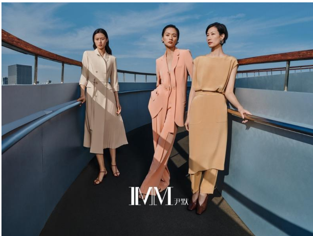
IMM 尹默 重庆北城天街店