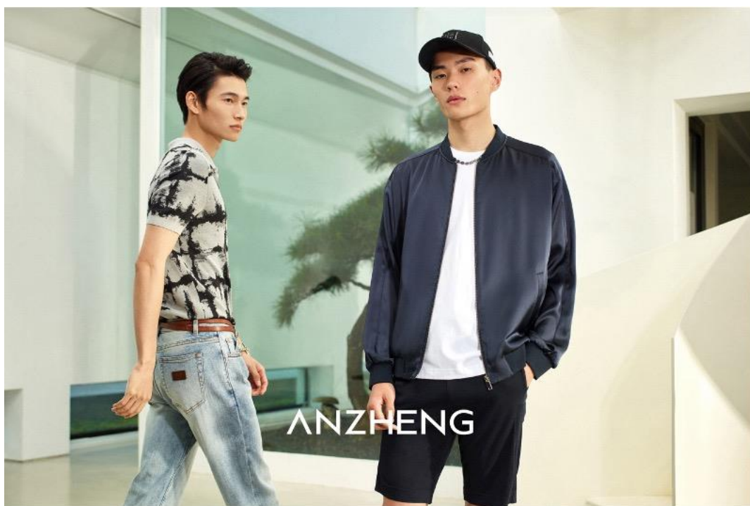
ANZHENG 安正上海久光百货店