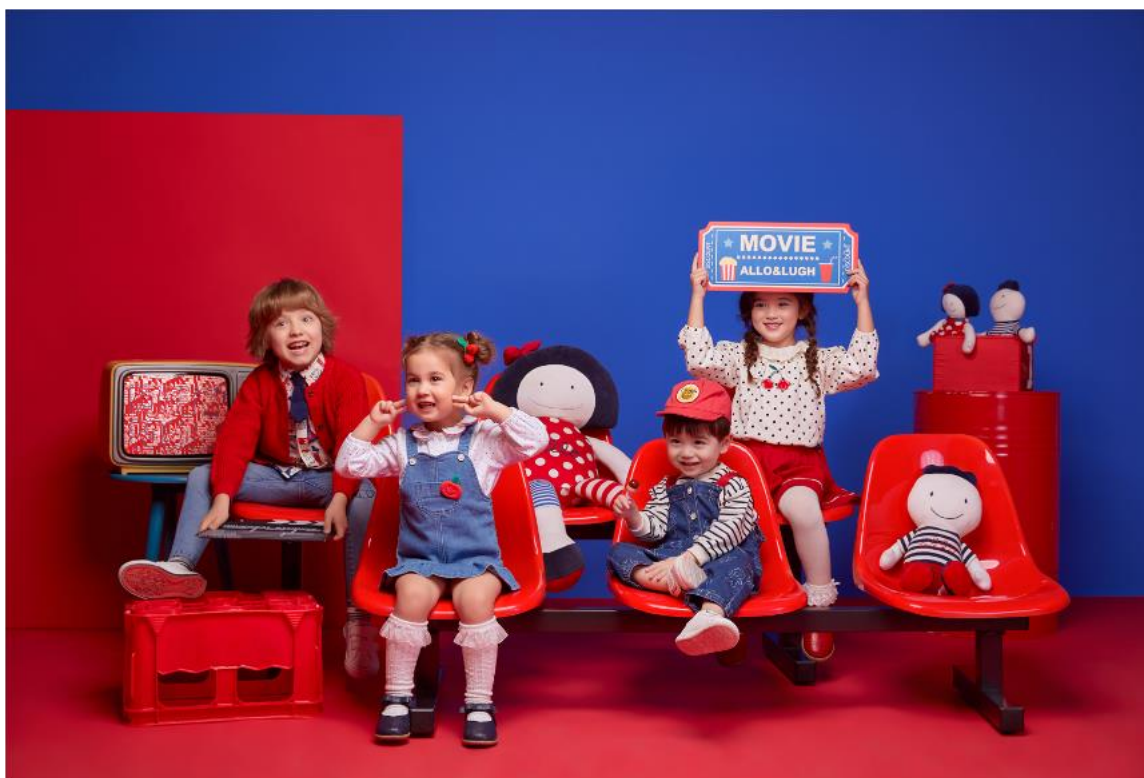
allo&lugh 阿路和如 江苏淮安新亚店