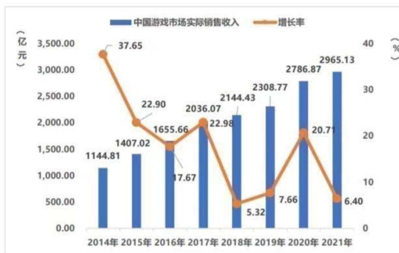
图1 中国游戏市场实际销售收入及增长率